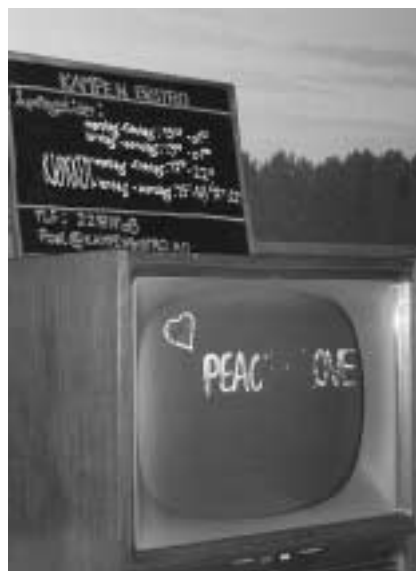
Velkomsthilsen. Veldig representativt for stemningen mange søker og finner på Kampen.