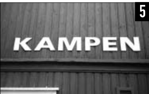
HVOR står navnet SÅ kraftfullt skrevet?