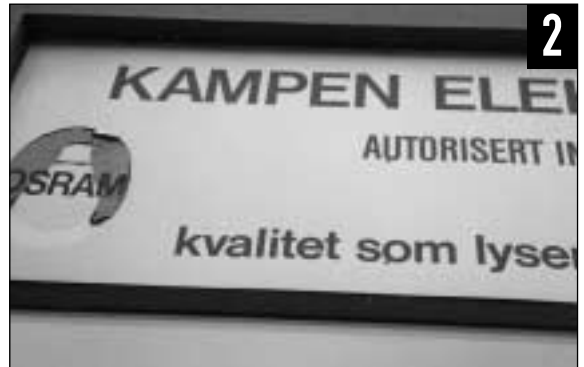
HVOR lyser kvaliteten som reklame på veggen?