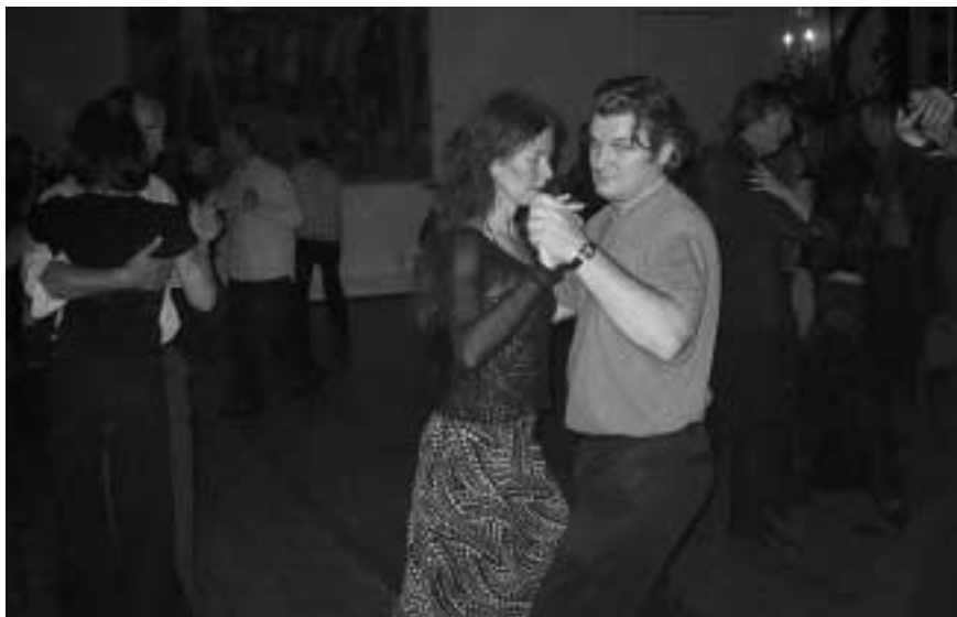
Dansegulvet på Kampen Menighetsbus er oftest fylt til randen når det arrangeres milonga på fredagskveldene.