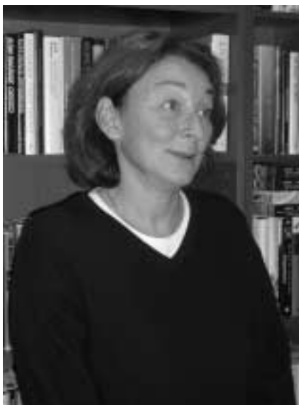
Likestillingsombudet er glad i å lese og er glad i norske forfattere og latinamerikansk litteratur.