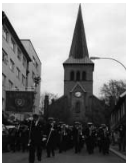
Kampen kirke ser ut til å ha avfunnet seg med at folk på Kampen på godt og vondt er noe for seg selv.