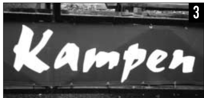
HVILKET STED har valgt så djerpe bokstaver på skiltet sitt?