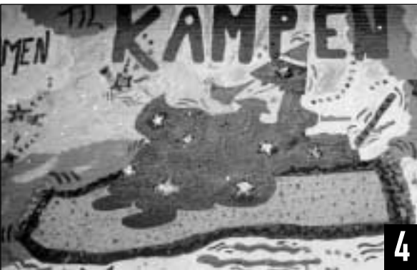
HVILKEN institusjon har slikt et festlig skilt?