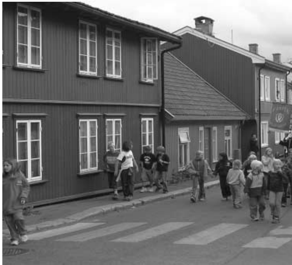
Kardemommekos eller det nye trendy?

Dahl er arkitekt, så interessen for nettopp bebyggelsen og miljøet er ikke tilfeldig. Han forteller videre: - Den gang var det mye småindustri både mot gaten og i bakgårdene. Og det var flere butikker. Sånn sett har det blitt