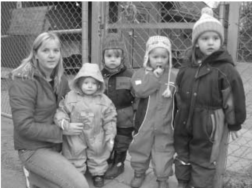
XX, XX, .... fra Kardemomme Barnehage synes det er trist at de ikke får besøke barnebondegården før jul.

Barnehagebarn fra Kampen kan se langt etter koselig førjulsbesøk på barnebondegården. På grunn av nedbemanning kan nemlig bondegården kun ta imot noen få barnegrupper – og ingen av de nærmeste barnehagene er prioritert. Dermed forsvinner en koselig tradisjon for Kampens barnehager.