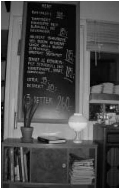
Menyen på Kampen Bistro skiftes hver dag. Overraskelsesmeny anbefales!