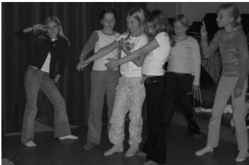
Kampen Barneteater gleder seg til å sette opp sitt nye stykke, som de i stor grad får være med på å utforme selv.