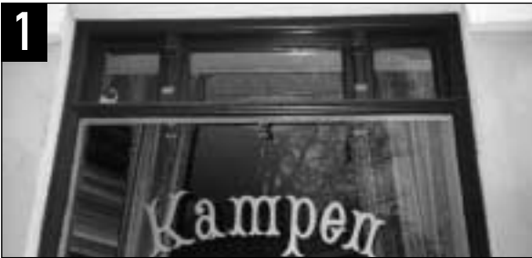
HVOR står disse fagre bokstavene på vinduet?

For inntil ca. 30 år siden ble Kampen regnet som den reneste slum, regulert til riving. Situasjonen snudde på 1970-tallet; Kampen ble det fineste fine på Østkanten, og Kampen-navnet et hedersnavn. Stoltheten over navnet slår også ut på firmabetegnelser: ”KAMPEN ditt” og ”KAMPENS ditt”. Men hvor holder de til, firmaene som har satt ”Kampen” i navnet sitt?