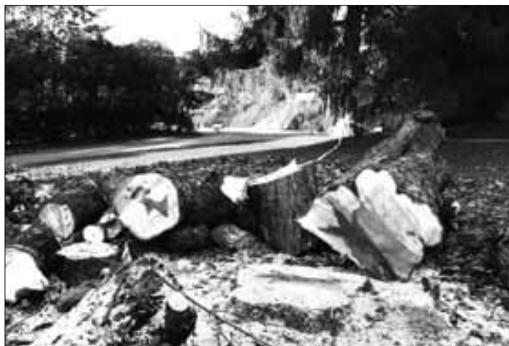
I høst brakk enda en grein av et av de store trærne i Kampen park og deiset i bakken. Deretter ble hele det digre treet dissekert.

– Nei, ingen behøver å føle seg utrygg. Dere har kraftige og robuste trær, og det skal for det aller meste uhyre kraftig vind til for å knekke et tre. Ved alminnelig godvær er faren minimal for at det knekker; man behøver ikke holde seg unna.