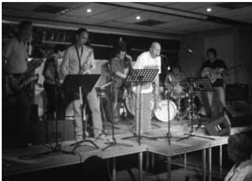
Kampen Scene ligger og venter på å bli tatt i bruk - kanskje av nettopp deg? Her fra en jamsession i forbindelse med Kampendagene 2006.