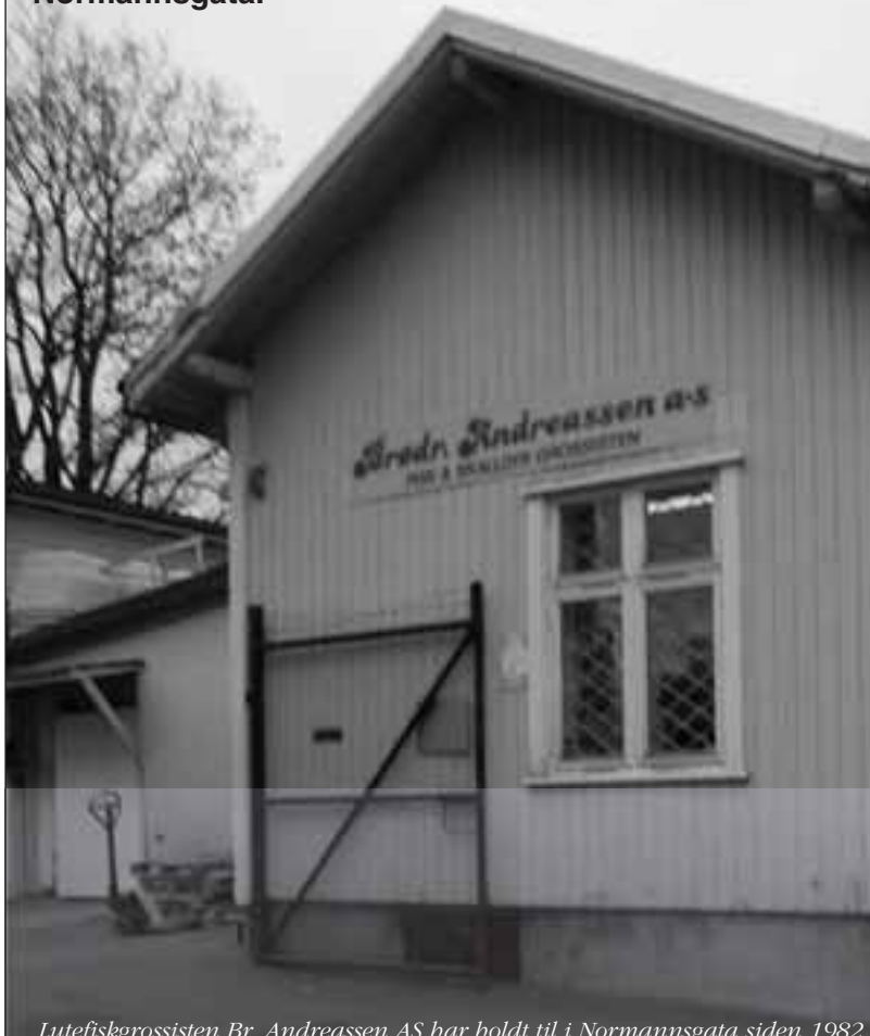
Lutefiskgrossisten Br. Andreassen AS har holdt til i Normannsgata siden 1982.

Juletid er lutefisktid for mange, og går du på lutefiskmiddag på restaurant eller spiser det hjemme på julaften, er sjansen meget stor for at den har vært innom en tur nederst i Normannsgata.