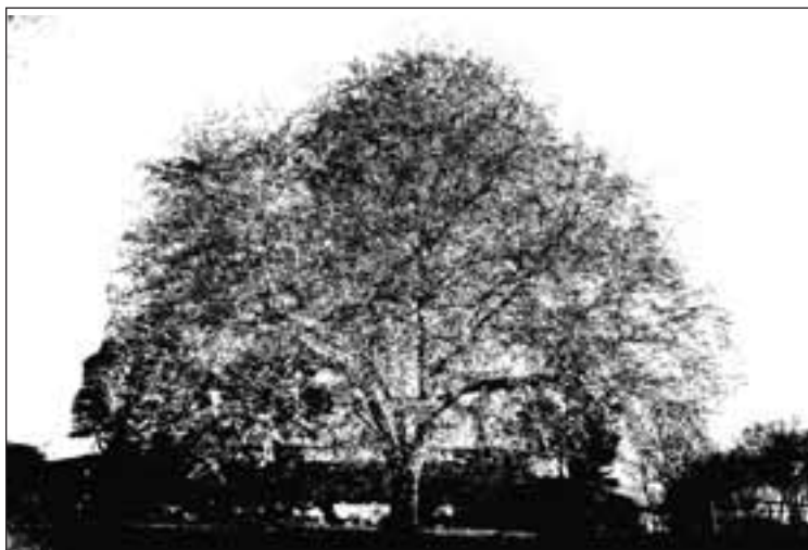
Vannbassengets vokter er et mektig skue.