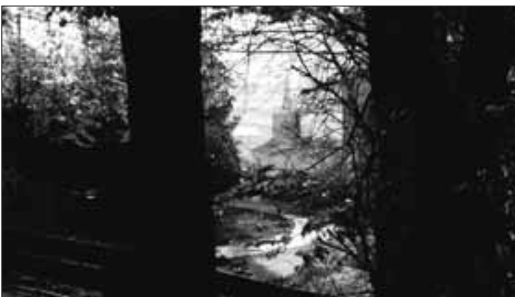
Trærne både skjuler og gir innsikt, som her hvor Grønland kirke blir litt ekstra mystisk.