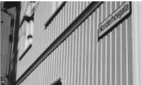
Før byutvidelsen i 1879 het Norderhovgata ”Bruns gade”.