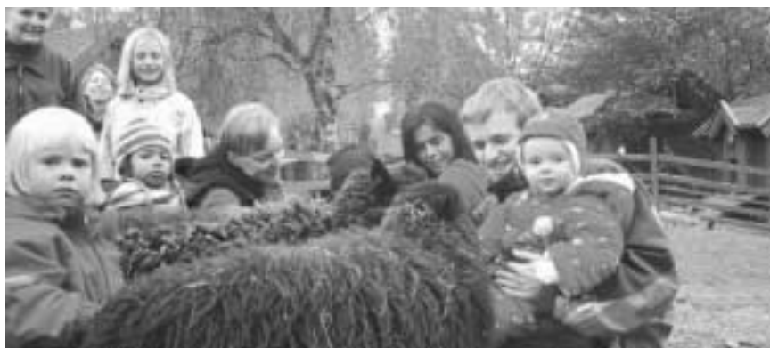
Bondegårdsbesøk er populært blant skoler og barnebager i nærområdet. Her er det barn og voksne fra Jordal Barnebage som hilser på sauene.

– I tillegg til heder og ære vil vi få 10 000 kroner i prispenger!