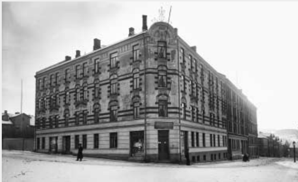
Norderhovgata 11 i 1904.

De opprinnelige beboerne besto for en stor del av håndverkere, som f.eks. to smeder og fem smedarbeidere, to skomakere, en snekkermester, en snekker og en snekkerarbeider, en murer og en murarbeider, to høvleriarbeidere, en typograflærling og en maskinist. Gården huset også mer typiske arbeidere som tre fabrikkarbeidere, en løsarbeider, en arbeidsmann, og dessuten fire kjørekarer