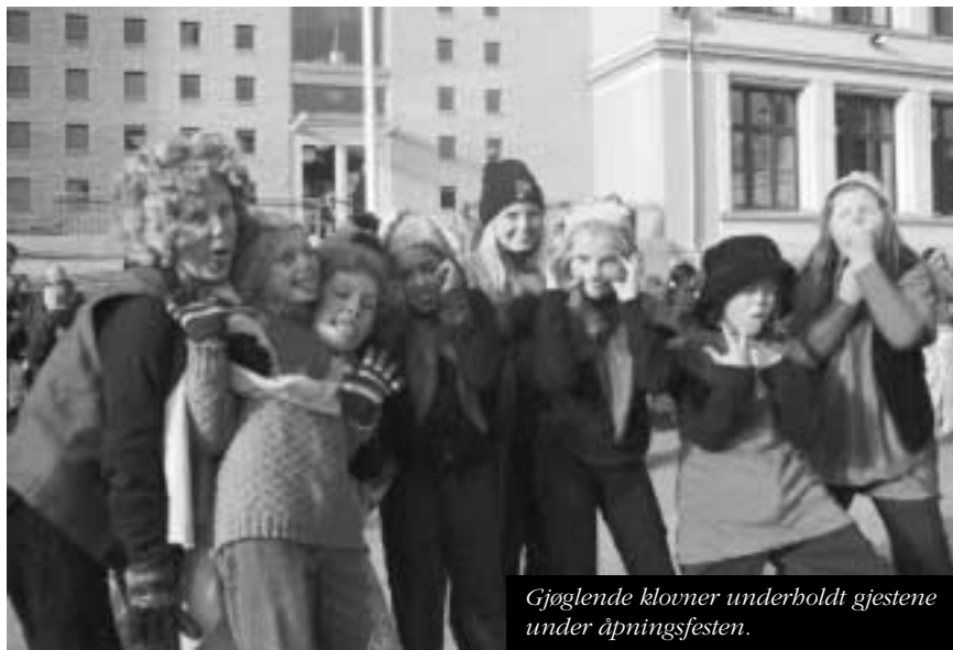
Gjøglen klovner underholdt gjestene under åpningsfesten.