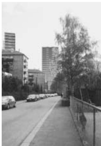
Dette kan bli nye Ensjøs "skyline" sett fra Skedsmogata.

Planprogrammet for hele Ensjø-området legger opp til tre ulike utbyggingsnivåer. Trafikkøkningen er beregnet til et sted mellom 7.000 og 14.000 flere biler i døgnet. På grunn av nærheten til T-banen foreslår Plan- og bygningsetaten et vesentlig lavere antall parkerings-