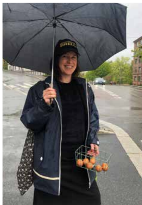
Utenfor boligen i Hagegata, på vei til jobb med dagens motiv – brune egg fra Rekoringen.

– Det meste i vår leilighet er funnet på gjenvinningstasjoner eller loppemarkeder. Mannen min kan bli fortvilet, for nå er det jo egent-