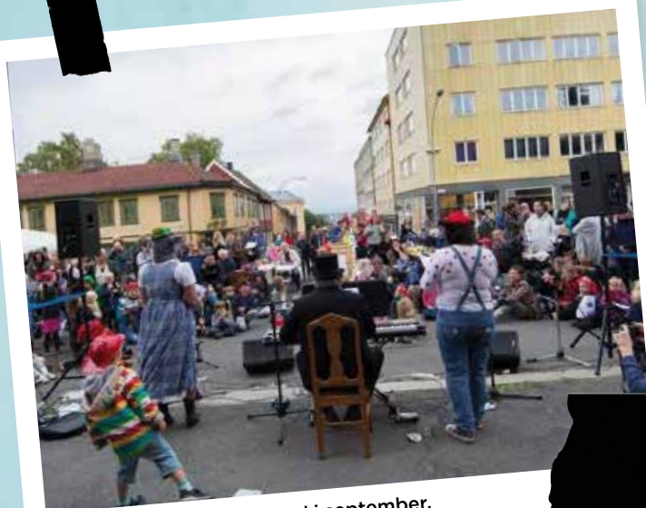
Vi planlegger Egnermarked i september.

bidrar til å opprettholde bomiljøet vårt!