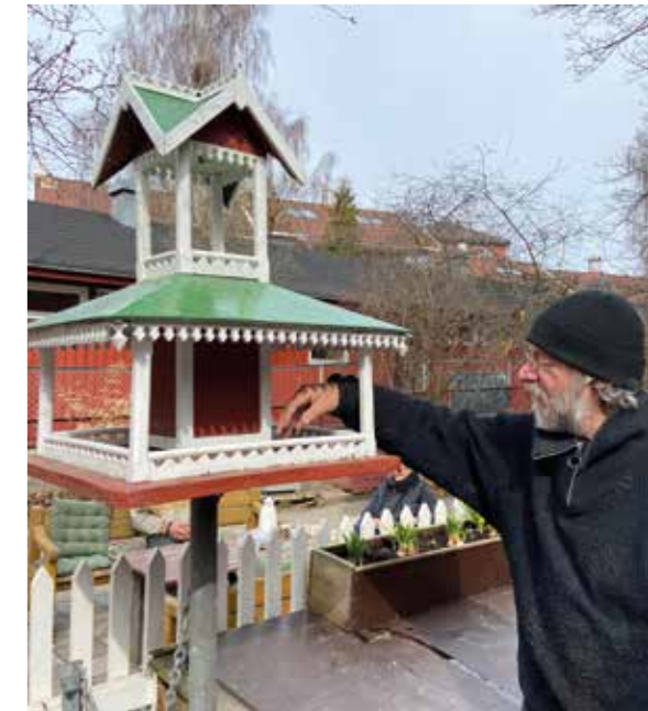
Oddvars vakre fuglehus i Hurdalsgata er et yndet fotomotiv blant folk som går tur på Kampen. Nå får også fuglene i Hundremeter- skogen flytte inn i Løkse-bygg.

Tekst: Anne Mette Ødegård.