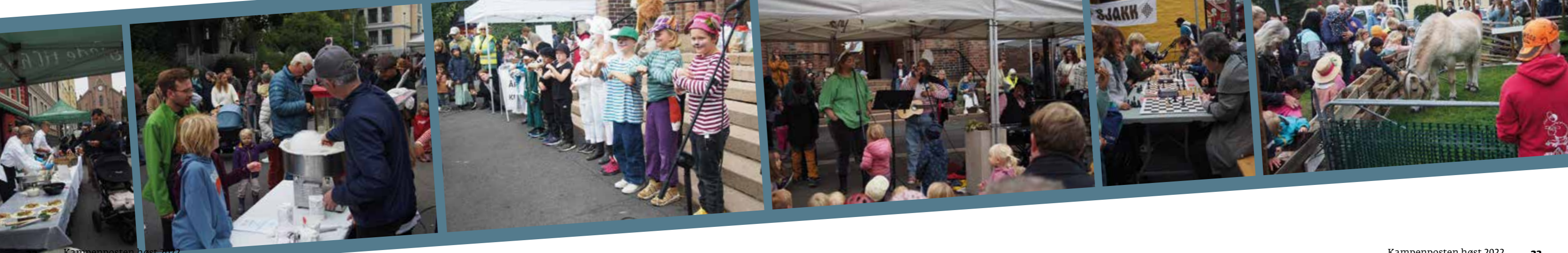
Mye godt å spise, spennende aktiviteter og fin underholdning.