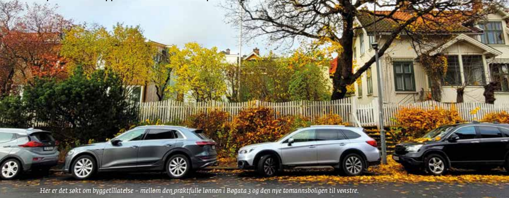
Her er det søkt om byggetillatelse – mellom den praktfulle lønnen i Bøgata 3 og den nye tomannsboligen til venstre.

Byantikvaren opprettholder sin sterke fraråding