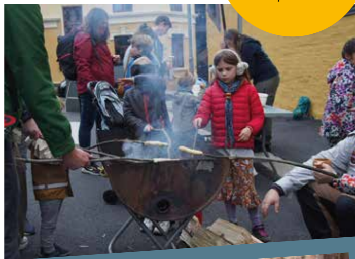
Kampenspeiderne på plass med bålpanne og pølser.