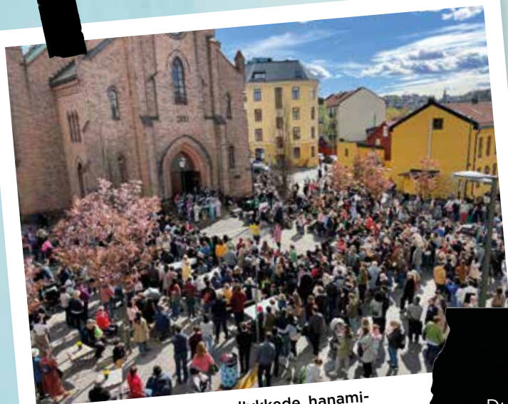
Fra den første, og svært vellykkede, hanami-feiringen i april 2022.

bidrar til å opprettholde bomiljøet vårt!