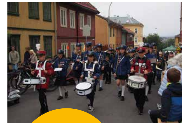
Kampen skoles musikkorps spilte og marsjerte.