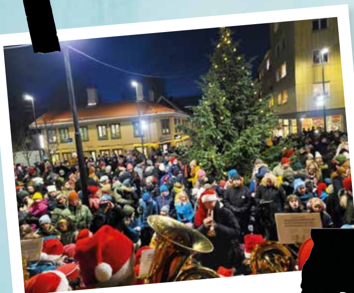
Fra julegrantenning på Thorbjørn Egners plass.

bidrar til å opprettholde bomiljøet vårt!