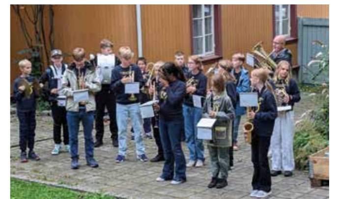
Kampen skoles musikkorps bidrar med «Kampensangen» på jubileumsfesten til Familiekroken.