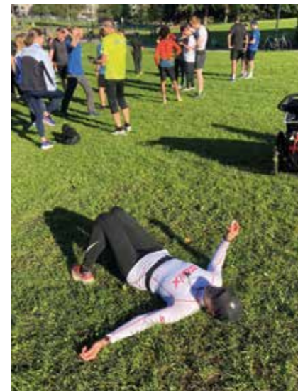
En kan ikke komme unna at en blir litt sliten.