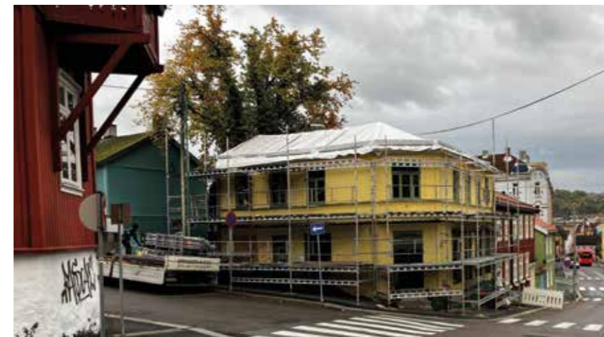
I begynnelsen av oktober kom det opp stillas rundt Skedsmogata 1.