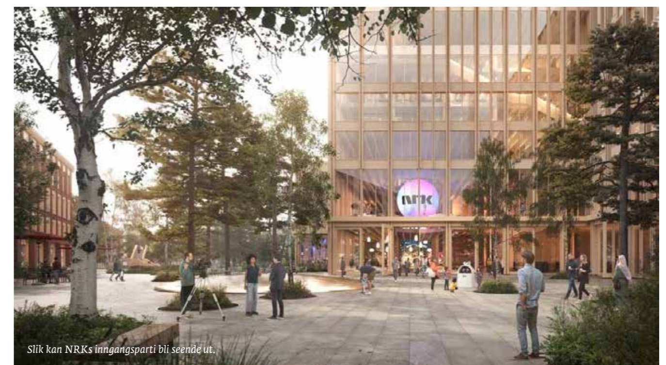
Slik kan NRKs inngangsparti bli seende ut.

På denne illustrasjonen er det nye hovedkontoret tegnet inn som hvite bobler inn som hvite bobler merket "næring". Til venstre kan man se Kampen park.