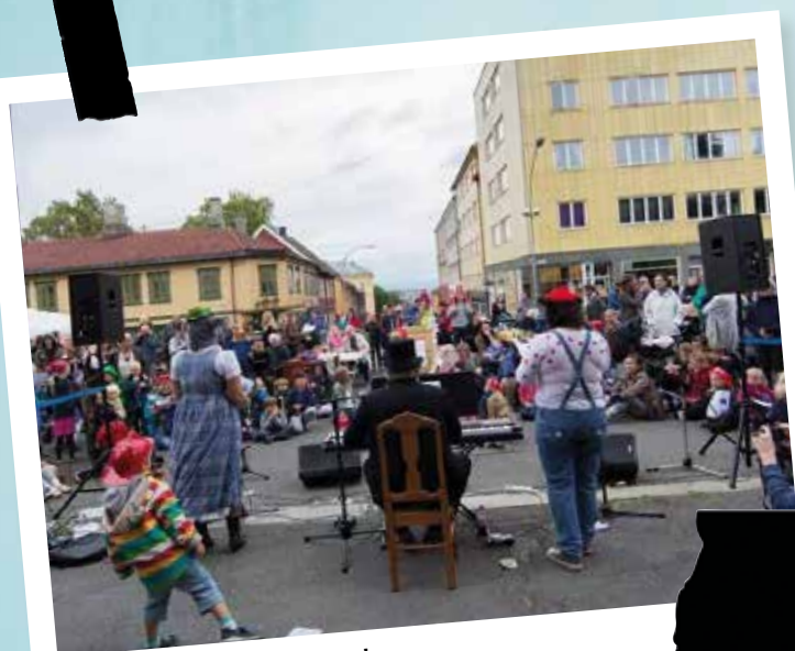
Vi arrangerer Egnerdagen!

Som medlem er du med og verner om Kampens kultur og sørger for at bydelen vår beholder sitt særpreg.