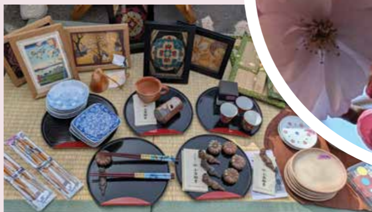
Mye spennende å finne i salgsbodene.