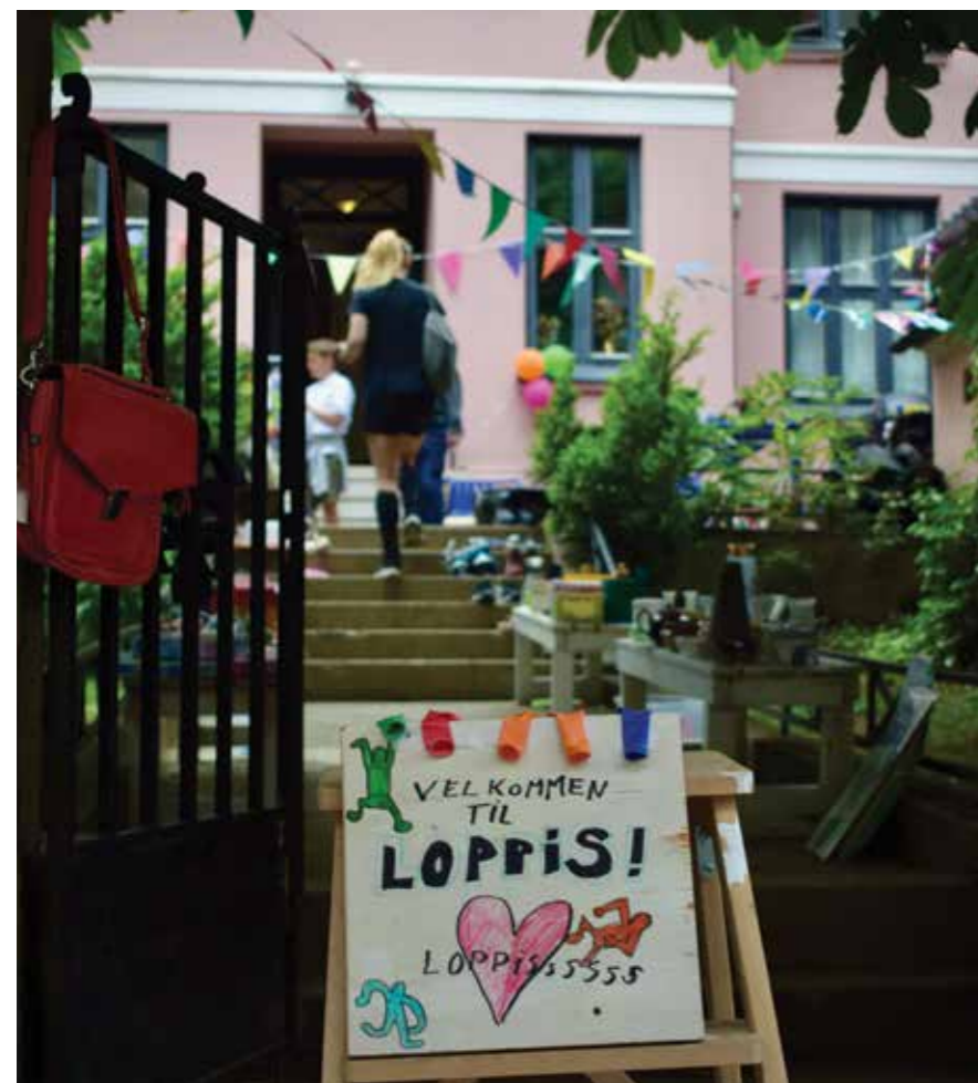
Åpen bakgård ble en stor suksess. Mange benyttet også sjansen til å lage små loppemarkeder i bakgården.