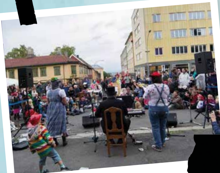
Vi arrangerer Egnerdagen!

bidrar til å opprettholde bomiljøet vårt!