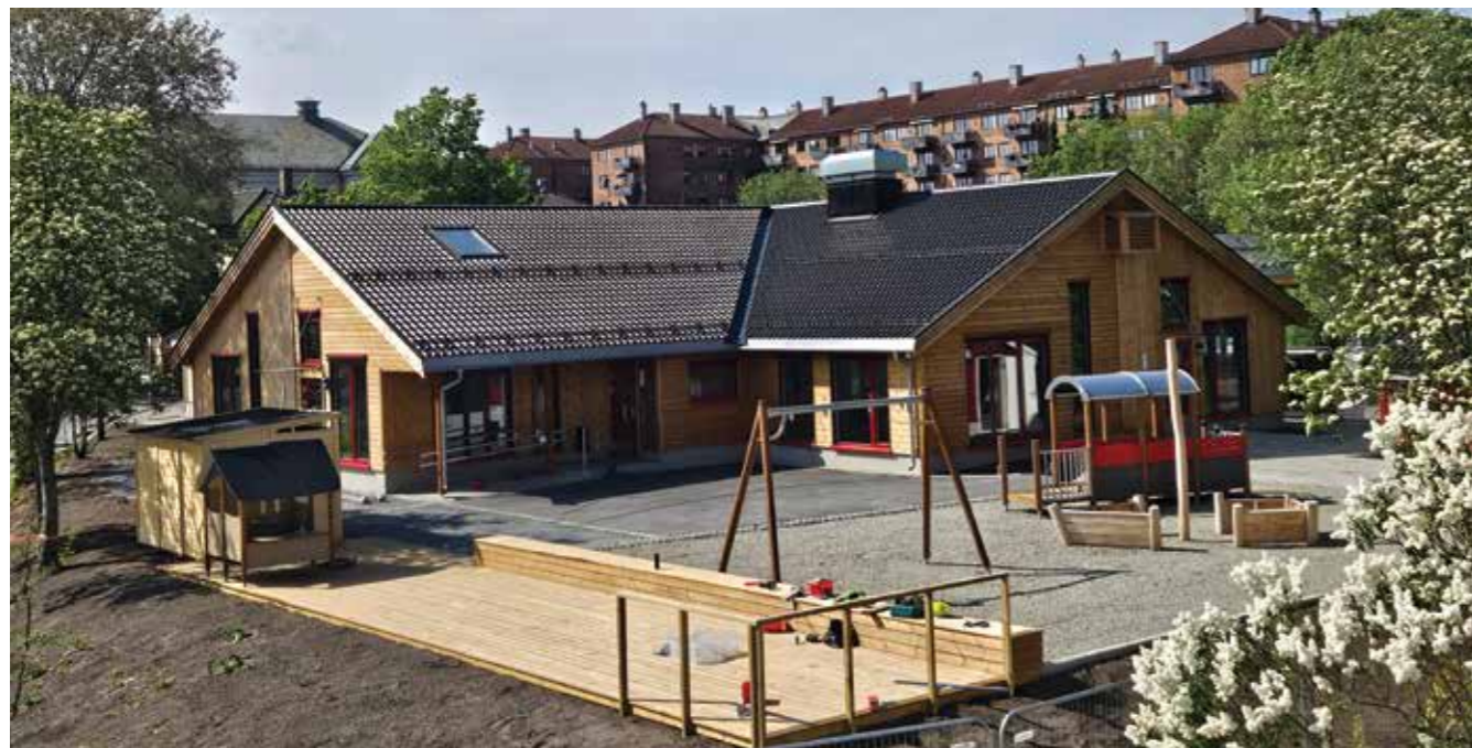
Foreldre er fornøyde med barnehagene på Kampen. Snart kan barnehagebarn flytte inn i helt ny Kampen barnehage, som åpner til høsten.