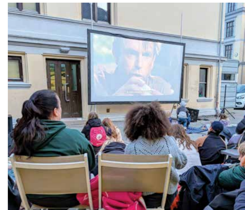
Lys vårkveld. Det var ikke før etter at sola gikk ned at man kunne se skuespilleren Sam Neill godt.

Utekino er væravhengig, alltid et sjansespill. Det ble kanskje ikke full klaff denne gangen, men vi heier på arrangørene og takker for godt initiativ. Det er kanskje lettere med utekino på høsten?