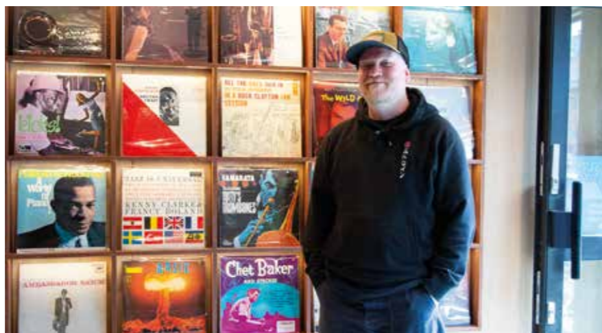
Det går mest i jazz hos Kampen Vinyl. Poenget er ikke å være et overskuddsforetak.