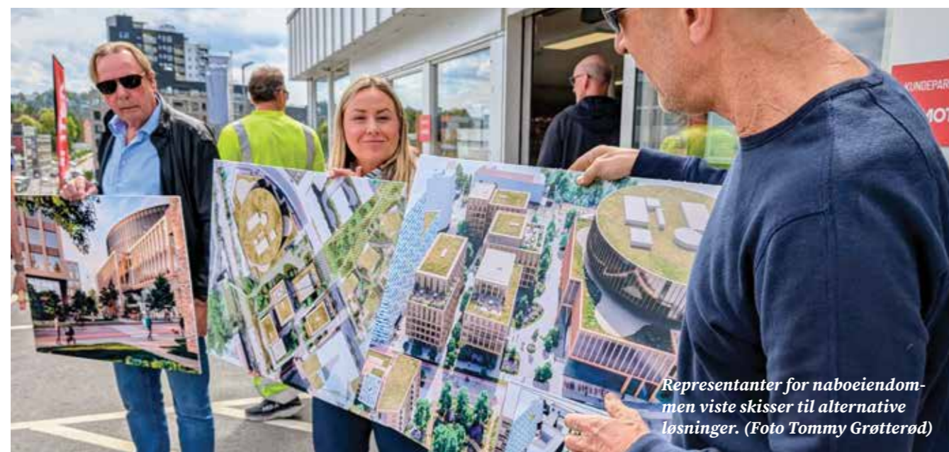
Representanter for naboeiendommen viste skisser til alternative løsninger.

Teksten er skrevet av Robert Lorange og Tommy Grøtterød 1. juni 2026