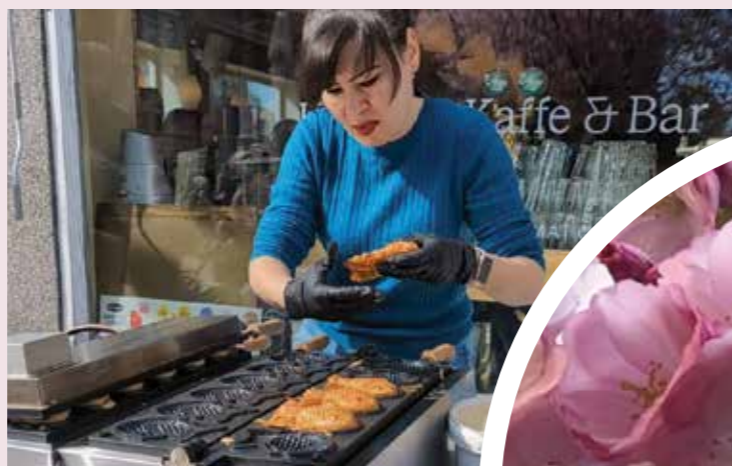
Diana steker taiaki seks timer i strekk.